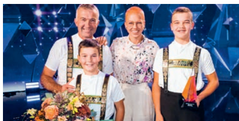
Die Teufner Familienkapelle «Tüüfner Gruess» waren die Siegerformation der SRF-Show «Stadt-Land-Talent» 2021

Die Uhr dreht unbeirrt ihre Runden. Wir werden älter. Jahr für Jahr. In den Übergängen der Jahre blicken wir bewusst zurück auf Vergangenes und die Fragen nach der Zukunft: Was das neue Jahr wohl bringen wird? Zum hoffnungsvollen Start in ein neues und hoffentlich besseres Jahr spielt die Teufner Familienkapel-